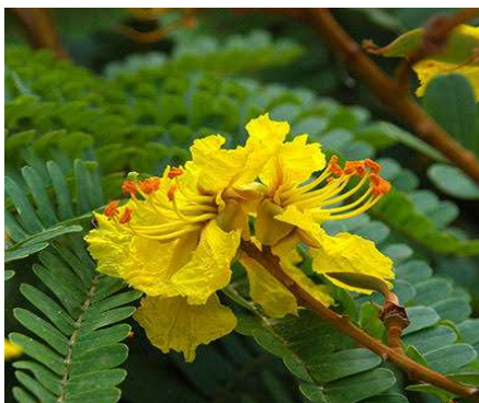
ดอกกนทรี ชื่อทางวิทยาศาสตร์ Peltophorumpterocarpum