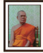
พระราชธรรมคณี ที่ปรึกษาเจ้าคณะจังหวัดพิษณุโลก