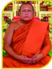
พระวินัยสาร เจ้าคณะจังหวัดพิษณุโลก-อุตรดิตถ์ (ธรรมยุต)