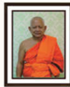
พระรัตนโมลี รองเจ้าคณะจังหวัดพิษณุโลก (๒)